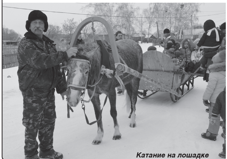
Катание на лошадке