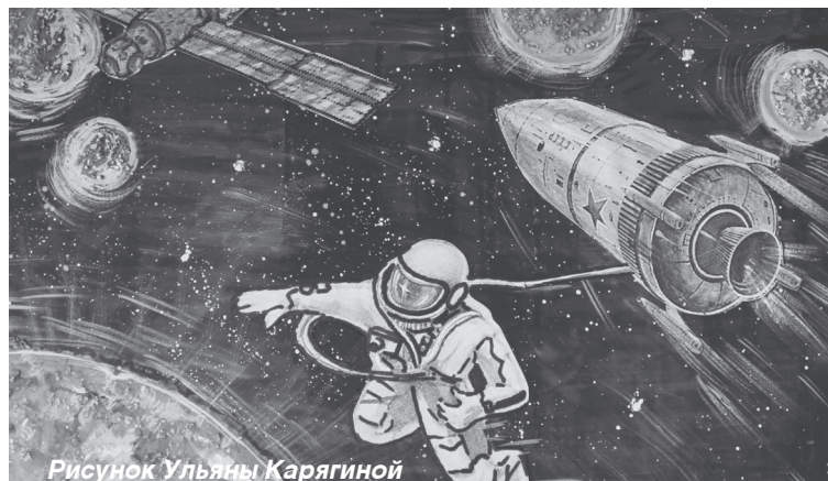
Рисунок Ульяны Карягиной

В этом году исполняется 60 лет первому полету человека в космос. Он состоялся 12 апреля 1961 года. Это одна из самых важных вех в истории всего человечества. Шесть десятков лет назад советский летчик-космонавт Юрий Алексеевич Гагарин сказал: «Поехали!», открыв эру освоения человеком космического пространства.