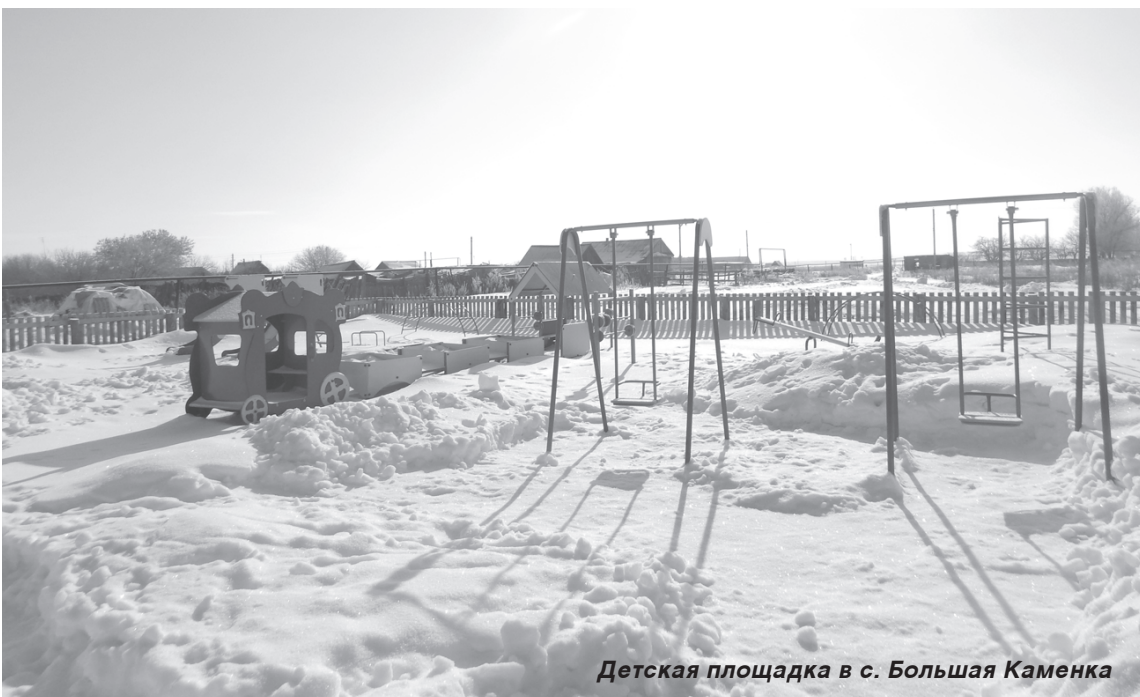
Детская площадка в с. Большая Каменка

проектов развития муниципальных образований области, основанных на местных инициативах: